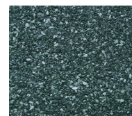
Grå EAN 6417443301948