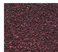
Rød EAN 6417443301917